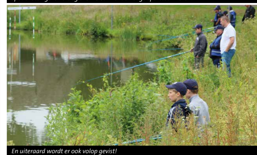
En uiteraard wordt er ook volop gevist!

De jeugddag 2016 van Hengelsport Federatie Midden Nederland wordt georganiseerd samen met de Borculose Hengelsportvereniging, HSV de Brasem uit Lochem, WHV de Karper uit Winterswijk, de Reurlese vissers uit Ruurlo en HSV het Voorntje uit Eibergen.