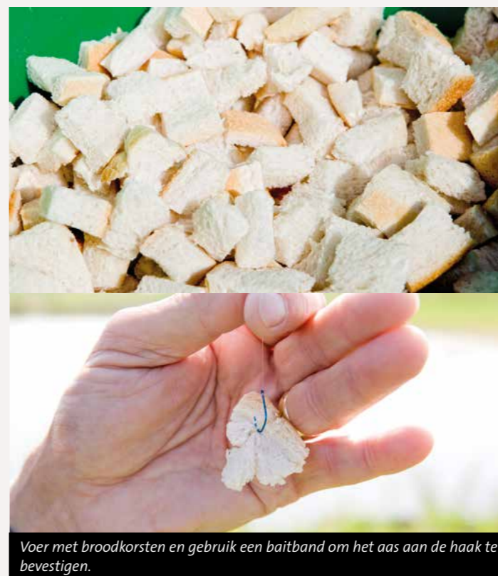
Voer met broodkorsten en gebruik een baiband om het aas aan de haak te bevestigen.

Bij het korstvissen op winde ga je actief op zoek naar de vis. Het heeft namelijk weinig zin om een uur aan hetzelfde kribvak te blijven staan. Struin verschillende kribvakken af, dat levert je geheid meer vis op. Voer op een nieuwe stek eerst twee handjes broodkorsten voordat je een korst met haak te water laat. Zit er winde dan zal die