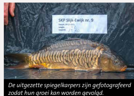
De uitgezette spiegelkarpers zijn gefotografeerd zodat hun groei kan worden gevolgd.

De schubkarpers zijn direct uitgezet, maar de spiegelkarpers zijn gemeten, gewogen en van beide zijden gefotografeerd. Zo kunnen deze vissen worden gevolgd aan de hand van vangstmeldingen van sportvisserij. De foto's van de karpers zijn daarom op de Facebookpagina SKP-Regio-Midden geplaatst. Meldingen van vangsten kunnen hier ook worden doorgegeven. Slijk-Ewijk is opgenomen in de Gezamenlijke Lijst van Nederlandse Viswateren en hier mag 's nachts en met drie hengels worden gevist.