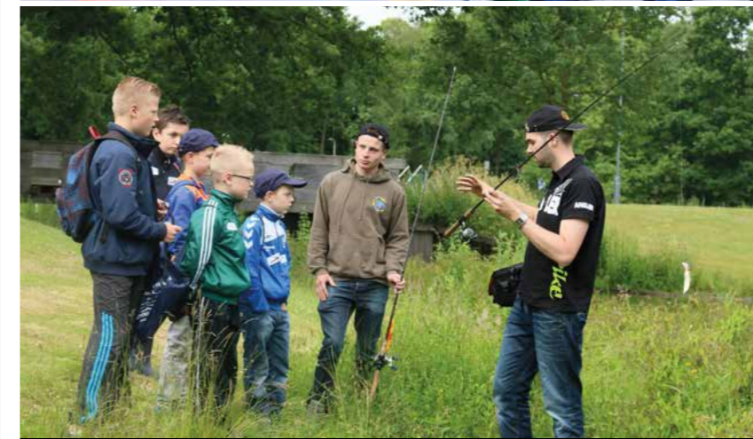
Specialisten geven uitleg over verschillende hengelsporttechnieken.

De jeugddag start om 09:00 uur en is uiterlijk om 16:00 uur afgelopen. Eten en drinken hoeft je niet mee te nemen, daar zorgen wij voor. Ook het benodigde hengelsportmateriaal om een vis te kunnen vangen zal aanwezig zijn. Aan alles is dus gedacht. Natuurlijk is het nog leuker om samen met je vrienden en vriendinnetjes naar de jeugddag te komen, dus neem die vooral ook mee. Houd tenslotte onze website en facebookpagina in de gaten voor meer informatie over de jeugddag op 18 juni in Borculo!