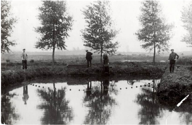
Het afvissen van een vijver in Vaasen, begin 1900.

warme zomer en komen er bij de afvissing in de herfst van 1899 als eerste oogst 4850 stuks zeer schoone exemplaren van 10-22 centimeter lengte aan wal. De karpers zijn gevarieerd van beschubbing en bestaan uit schubkarper, spiegelkarpers en lederkarpers.