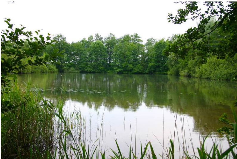
Relicten van de Vaassense kweekvijvers anno 2014.