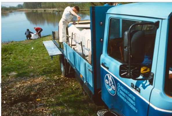
Aflevering van karper bij een hengelsportvereniging

Rond 1973 vraagt de hengelsportpers steeds vaker naar het opnemen van wilde karpers in het OVB-kweekprogramma. Het argument hierbij is dat wilde karper door zijn vechtlust meer hengelplezier oplevert dan de kweekkarper van de OVB. Als gevolg van de voorkeur van de karpervissers én de hoge resistentie tegen visziekten worden vanaf 1974 door de OVB nog uitsluitend schubkarpers met 25% wildbloed gekweekt. Een aantal invloedrijke karpervissers vindt echter dat deze karpers nog niet de gewenste bouw en vechtlust hebben, als gevolg van het hoge aandeel veredeld bloed.