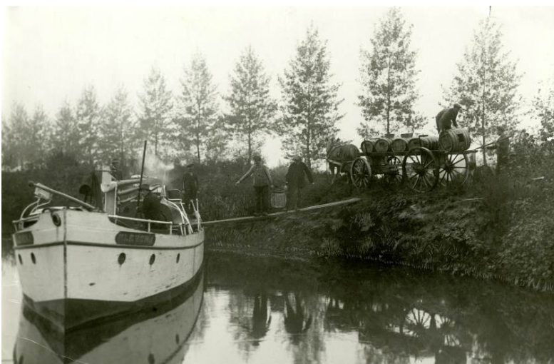
Tonnen met éénjarige karpers worden vanaf een kar overgeladen voor verder transport.

De vraag naar de edelkarpers groeit. Overal in het land worden de vissen uitgezet in polders, meren, plantsoenvijvers en kasteelgrachten. Aan de meeste uitzettingen gaat een onderzoek van de Heidemaatschappij vooraf, gevolgd door een advies over de verzorging en onderhoud van de nieuwe visbezetting.