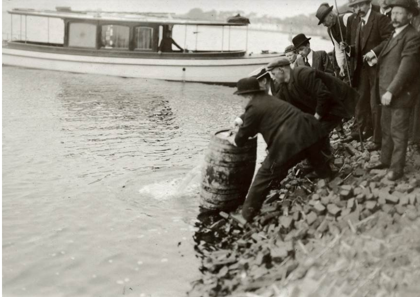
Uitzetting van karper in het Abcoudermeer in 1912.

Tijdens de Eerste Wereldoorlog remt het gebrek aan visvoer de productietoename op de kwekerij bij Vaassen. De vijvers zijn zo dicht bezet met vis, dat bijvoeren noodzakelijk is om te voorkomen dat de visbezetting omlaag moet worden gebracht. Graansoorten en bonen zijn in de oorlogsjaren te schaars om als visvoer te gebruiken. Er blijft maar één mogelijkheid over om aan de toenemende vraag naar pootvis te kunnen voldoen: de aanleg van meer vijvers. In de omgeving van Vaassen is daarvoor geen terrein meer beschikbaar. In Valkenswaard, waar de Heidemaatschappij al jarenlang grote ontginningswerkzaamheden uitvoert, vindt men een geschikte locatie. Hier ligt een bestaand complex van verouderde vijvers, die met wat modernisering geschikt worden gemaakt voor intensieve visteelt. In 1917 begint de exploitatie van het Viskweekbedrijf Valkenswaard, met een oppervlakte van 70 hectare. In 1919 bestaat de eerste karperproductie uit enkele tienduizenden eenzomerige vissen. In de daarop volgende jaren neemt het vijveroppervlak toe tot 120 hectare. De karpers worden als tweejarige karpers verkocht voor een goede prijs. Zo leveren de vissen in 1923 fl. 1,50 (circa 68 eurocent) per kilo op, waardoor de kwekerij een goed rendement behaalt.