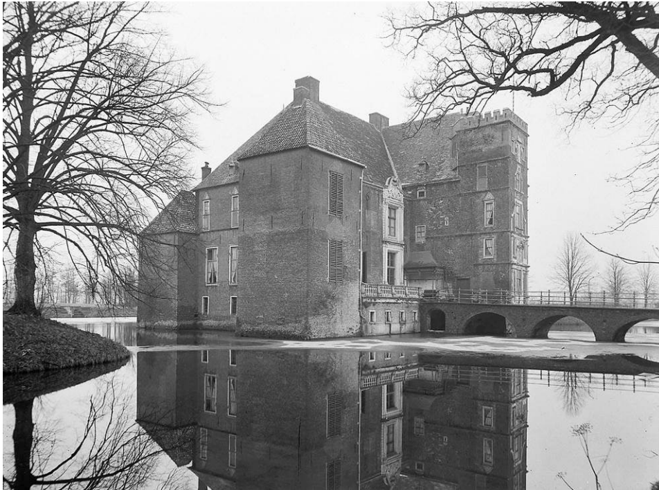
Vijvers kasteel Cannenburgh, geboorteplaats van de eerste in Nederland gekweekte karpers.